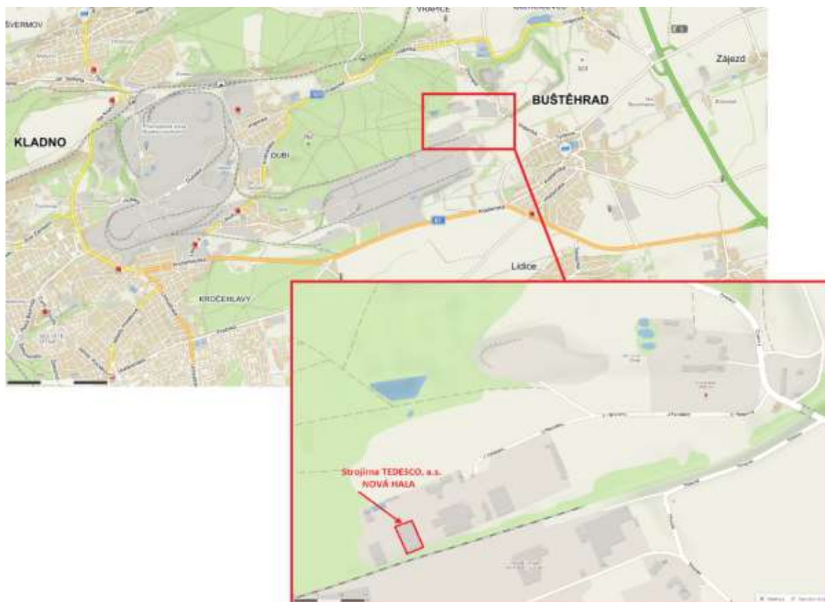
Areál Strojírenského vědeckotechnického parku s.r.o. (Hala H5)